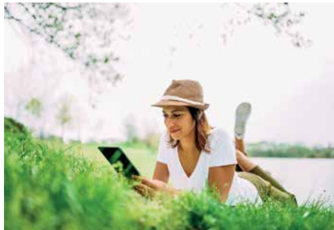
Entspannt auf der Wiese liegen - das gelingt mit einem guten Zeckenschutz.

Meist ist für die durch Zecken übertragenen Krankheiten in Deutschland der Gemeine Holz-