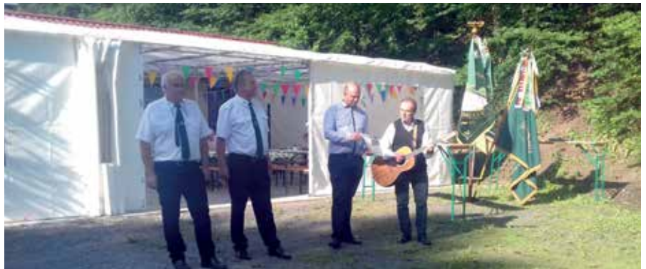
Für die Kinder steht eine Hüpfburg bereit.

Am Samstag, den 10.06.2023, beginnt das Schützenfest ab 15.00 Uhr für alle Freunde des Vereins mit einem gemütlichen Beisammensein bei Kaffee und selbstgebackenem Kuchen im Schützenhaus in der Benneckensteiner Straße in Sülzhayn.